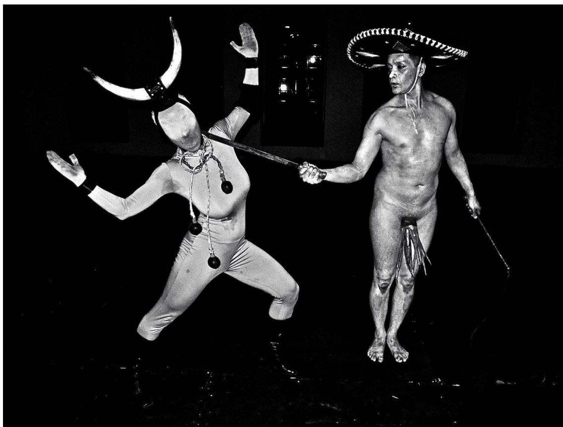
Photo credit: Dani d'Emilia and Saul Garcia Lopez. CASA, Oaxaca. Photo by Berenice Guraieb, 2012.

Η ομάδα La Pocha Nostra είναι μια διεπιστημονική καλλιτεχνική ομάδα με βάση της το Σαν Φρανσίσκο . Οι δράσεις της επεκτείνονται σε πολλές άλλες πόλεις και χώρες με στόχο την δημιουργία και υποστήριξη μιας κοινότητας καλλιτεχνών διαφορετικών καλλιτεχνικών ειδικοτήτων, φυλών και εθνικών καταβολών που διαρκώς αλλάζει και μετασχηματίζεται. Κοινός παρονομαστής των εφήμερων αυτών κοινοτήτων είναι η επιθυμία να προκαλούν, να διασχίζουν και να απαλείφουν τα όρια «επικίνδυνων» συνόρων μεταξύ τέχνης και πολιτικής, πράξης και θεωρίας, καλλιτέχνη και θεατή, καθοδηγητή και μαθητευόμενου, σώματος και πολιτισμικών στερεοτύπων. Χρησιμοποιώντας μοναδικούς συνδυασμούς διαφορετικών μέσων, διαφορετικές καλλιτεχνικές γλώσσες και τεχνικές αναπαράστασης, εξερευνούν τα σημεία συνάντησης ή σύγκρουσης των μεταναστευτικών ρευμάτων, την δημιουργία υβριδικών ταυτοτήτων, την δημιουργία πολιτιστικών συνόρων, την έννοια της παγκοσμιοποίησης και των νέων τεχνολογιών.